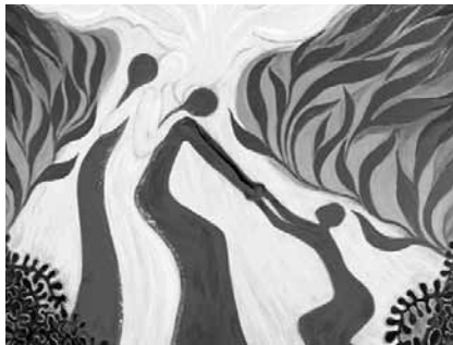
Motiv Weltgebetstag 2012

Wie immer hören wir in diesem Gottesdienst auch viel über das Land und die Freuden und Schwierigkeiten seiner Menschen: Malaysia hat zwei Landesteile – getrennt durch das Südchinesische Meer – die über 500 Kilometer auseinander liegen. Seine rund 28 Mio. Einwohnerinnen und Einwohner haben unterschiedliche ethnische, kulturelle und religiöse Wurzeln. Die Regierung des südostasiatischen Landes versucht mit allen Mitteln, Einheit und Stabilität zu erhalten. Der Islam ist in Malaysia Staatsreligion. Alle Malaiinnen und Malaien (rund 50%) sind von Geburt an muslimisch. Der Rest der Bevölkerung